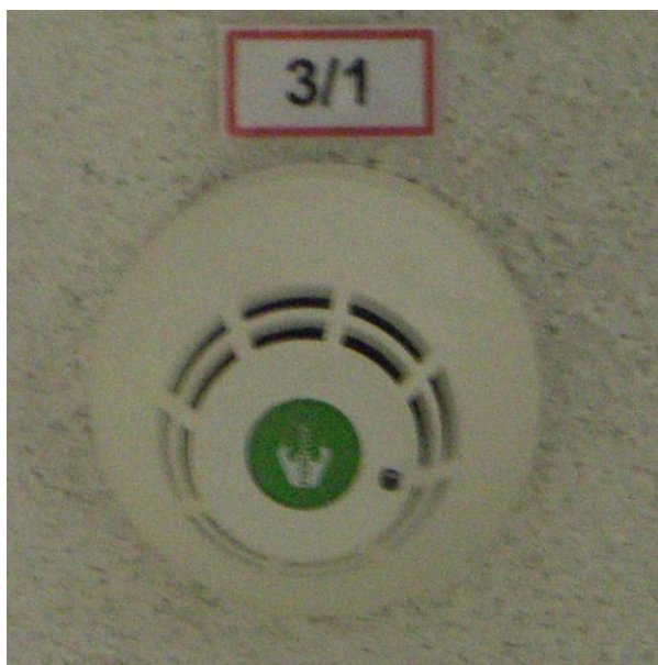
Beschilderung Meldergruppennummer / Meldernummer