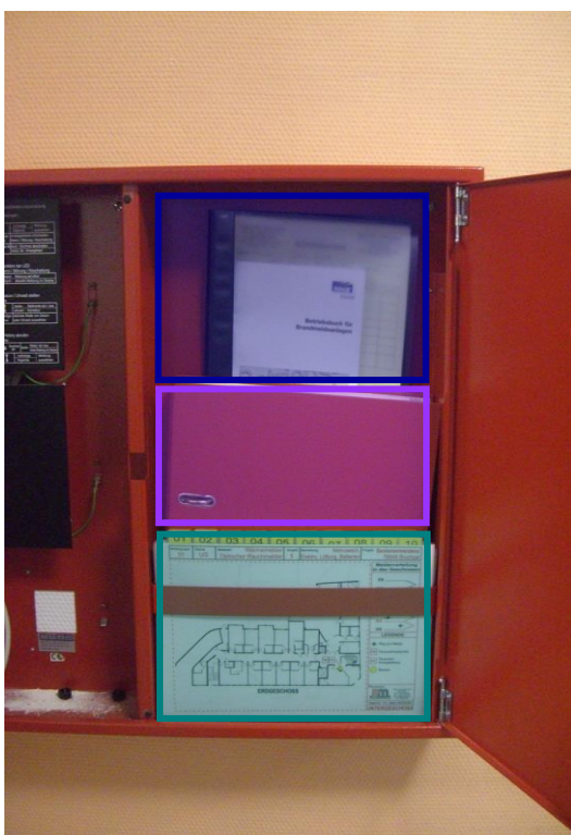
Betriebsbuch für Brandmeldeanlagen Feuerwehrpläne Feuerwehr-Laufkarten