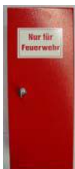
Halterung für Bockleiter