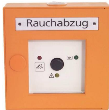
Abbildung 1: Beispiel Auslösestelle

Die Farben der Auslösestellen für sicherheits- und brandschutztechnische Einrichtungen sind festgelegt. Sie sind gemäß unten stehender Abbildungen zu wählen. Andere farbliche Ausführungen sind nicht zulässig. Als Auslösestellen sind Vds-zugelassene Gehäuse zu verwenden.