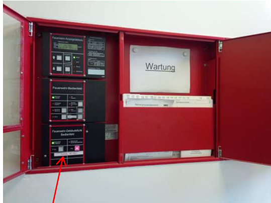
Gebädefunk-Bedienfeld unter Feuerwehrbedienfeld