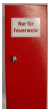
Halterung für Bockleiter