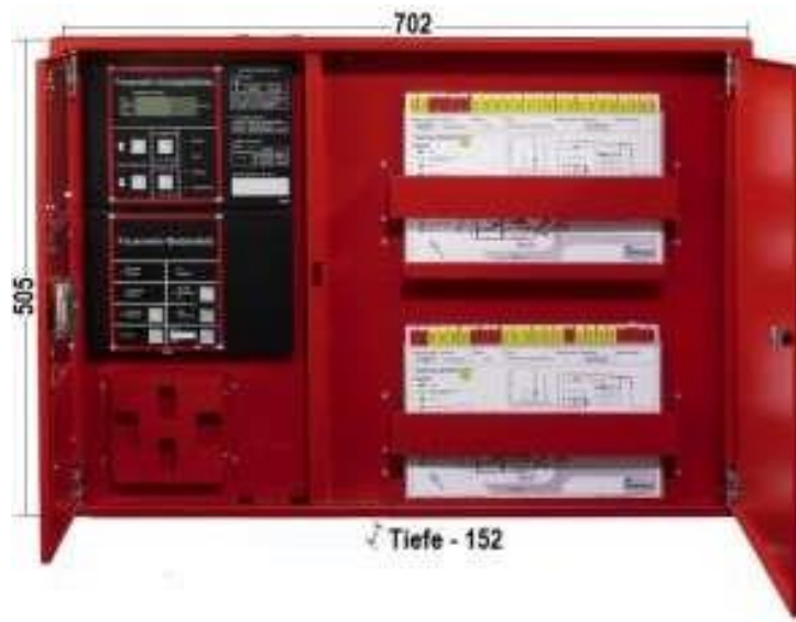
Abbildung 1,1: RLS Elektronische Informationssysteme GmbH

Das Beispielbild zeigt die Mindestbaugröße eines FIZ